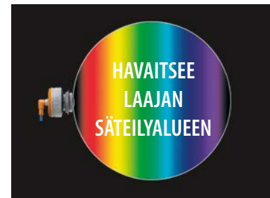
Havaitsee kaikki syttymislähteet

Täysi 180° asteen näkökenttä. Yksi ilmaisimien havaitsee koko kanavan poikkileikkauksen.