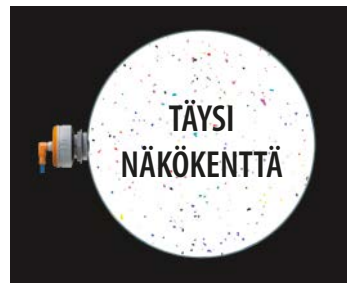
Uusi yhden ilmaisimen ratkaisu

Täyteen näkökenttään tarvitaan kaksi vastakkain asennettua ilmaisinta.