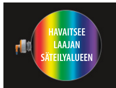
Havaitsee kaikki syttymislähteet

Täysi 180° asteen näkökenttä. Yksi ilmaisimien havaitsee koko kanavan poikkileikkauksen.