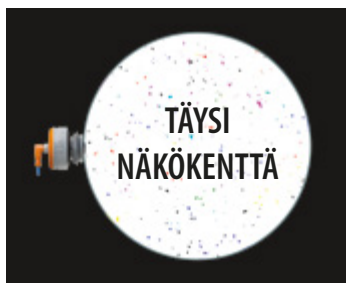
Uusi yhden ilmaisimen ratkaisu

Täyteen näkökenttään tarvitaan kaksi vastakkain asennettua ilmaisinta.